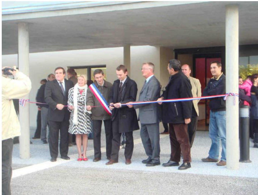
Inauguration de la nouvelle maison de retraite publique : « Le Balcon des Alpes »