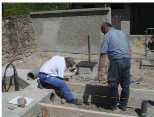
La borne est enfin ...

Vous ne le savez peut-être pas, mais en principe tous les ans, les réservoirs d'eau potable du village, situés au Mont Chaix et à la Croix du Saint Père, doivent être vidangés et chlorés. Les principaux captages sont également contrôlés à cette occasion.