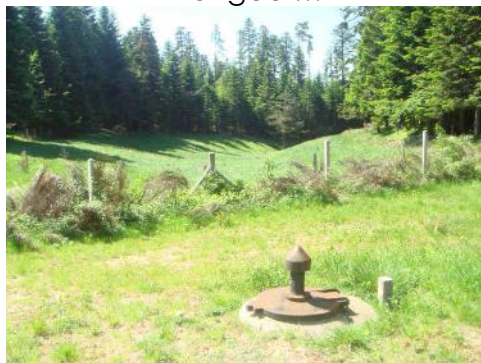
La source ...