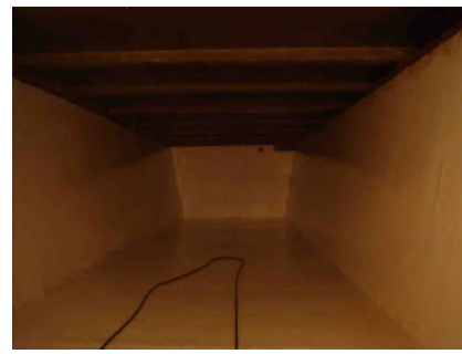
... du Mont Chaix