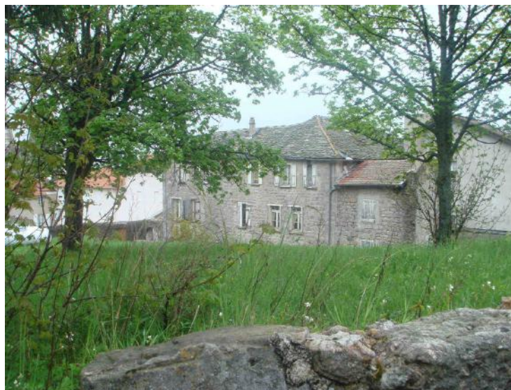
L'ancienne maison de retraite publique, une vieille dame deux fois centenaire, a fermé ses portes pour toujours.