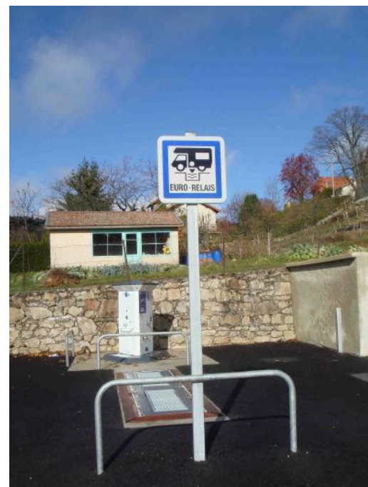
... et hors gel pour l'hiver !

Vous vous demandez sûrement pourquoi la borne a été mise en place si tardivement ! En fait, la réfection de la clôture chez les sœurs de Tournon, derrière la nouvelle maison de retraite, a accaparé pendant plusieurs semaines nos employés. Ces travaux, liés aux écoulements des eaux pluviales du nouvel EHPAD, n'avaient pas pu être achevés à l'automne dernier à cause des chutes de neige.