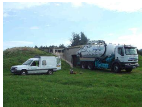
Nettoyage des réservoirs du St Père

Vous ne le savez peut-être pas, mais en principe tous les ans, les réservoirs d'eau potable du village, situés au Mont Chaix et à la Croix du Saint Père, doivent être vidangés et chlorés. Les principaux captages sont également contrôlés à cette occasion.