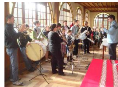
Hommage solennel aux dernières sœurs de St Joseph