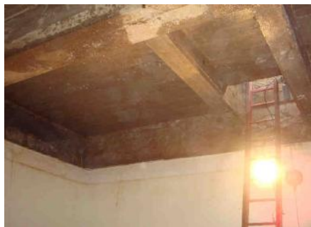
... dans les réservoirs ...