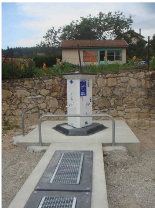
... opérationnelle ...