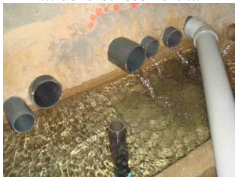
... du Perrier