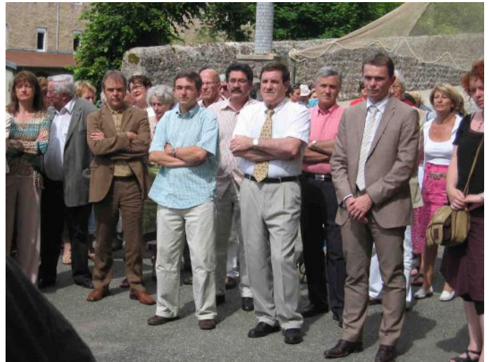
... après les discours des officiels

En ce qui concerne les arts plastiques, le 20 e Carrefour des Arts placé sous le signe des Peintres Officiels de la Marine Nationale a été un grand succès, attesté par un record absolu de plus de 9100 visiteurs et un livre d'or où une quarantaine de pages ont été remplies de commentaires très élogieux.