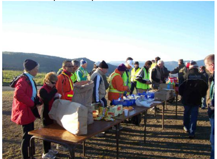
La marche Audax (4x25 kms)