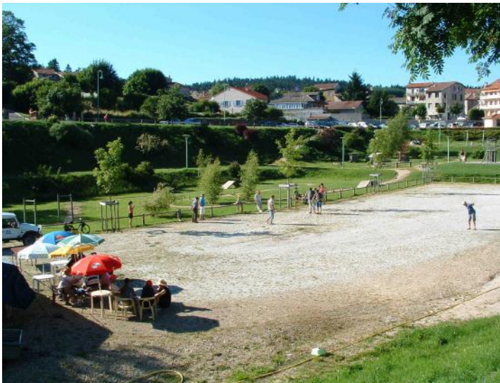
Les Concours de boules