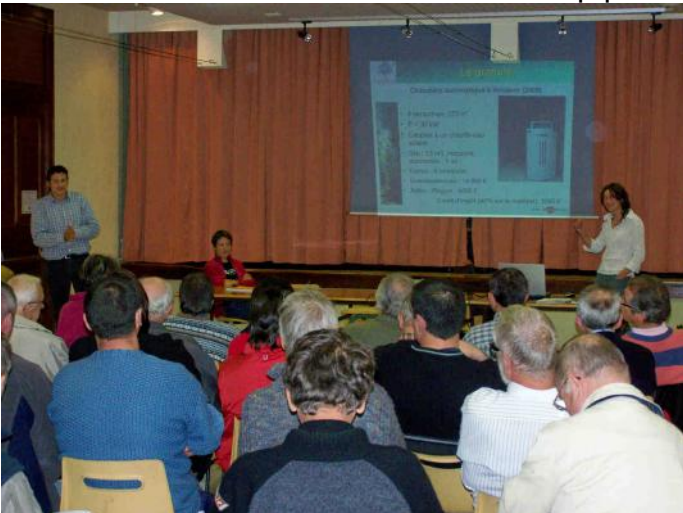
La soirée filière bois