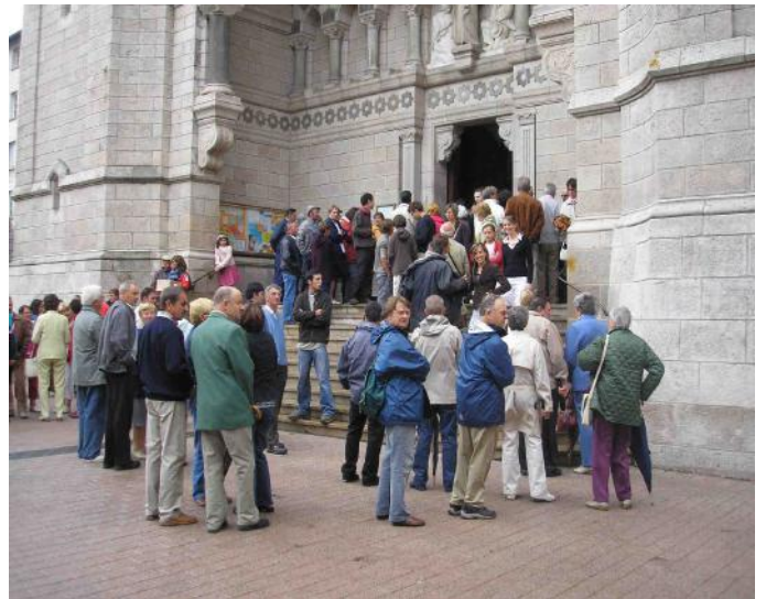
Le 15 août 2008