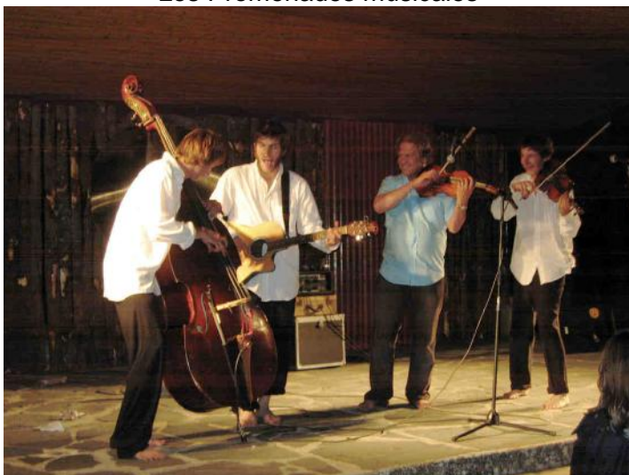
Les voleurs de swing au parc du Pèlerin