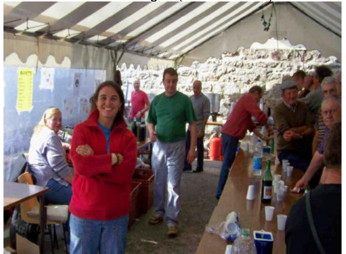
... et affluence à la buvette grâce à nos animatrices