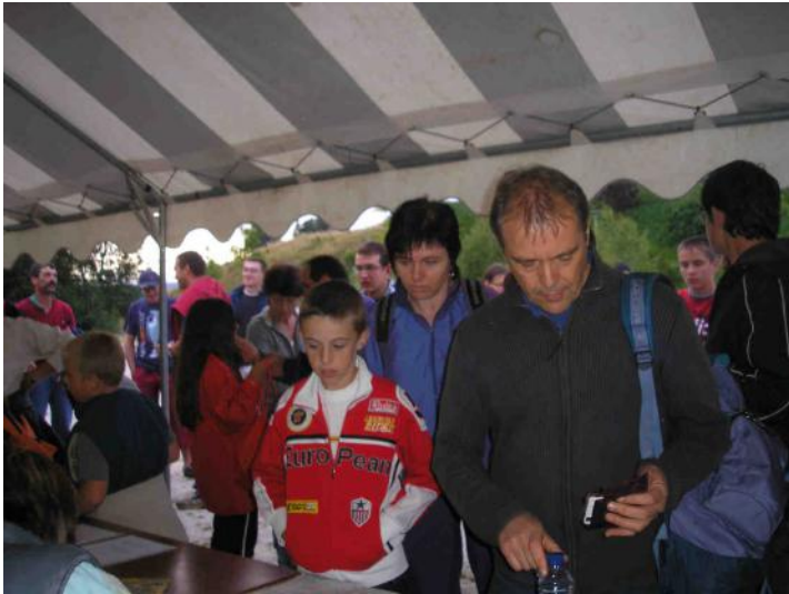
La Noctambule ...