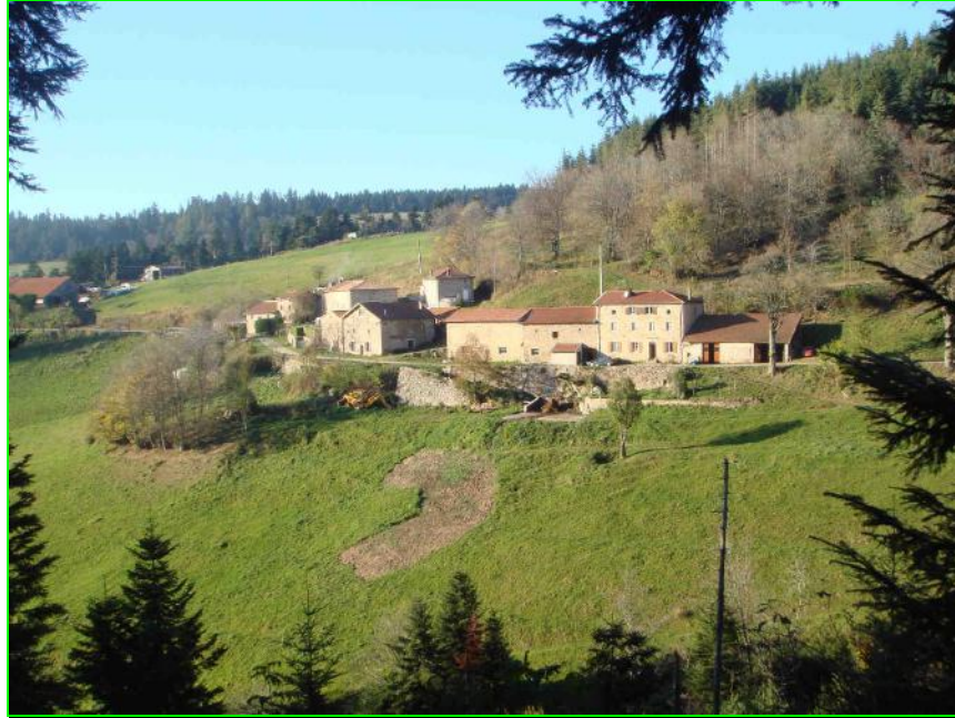
Le hameau du Crouzet

Aujourd'hui sortons du village en direction de Saint Bonnet-Le-Froid, tournons à gauche pour emprunter la voie communautaire qui passe sous le stade de football « Aimé DEYGAS » et, au bout d'environ deux kilomètres, nous arrivons dans le hameau du CROUZET dont l'origine du nom signifierait « petit creux ».