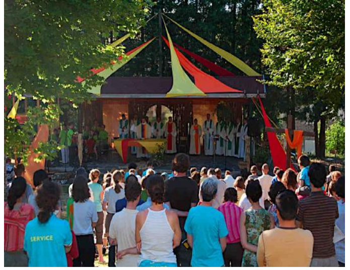
... au Parc des Pèlerins