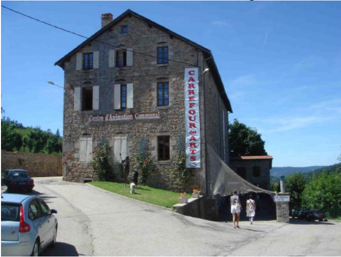
Le Carrefour des Arts