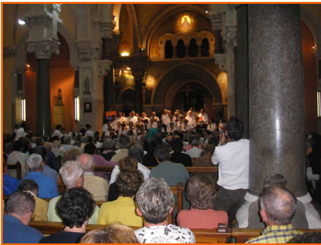
Ouverture de la saison par le concert caritatif au profit de la lutte contre le cancer