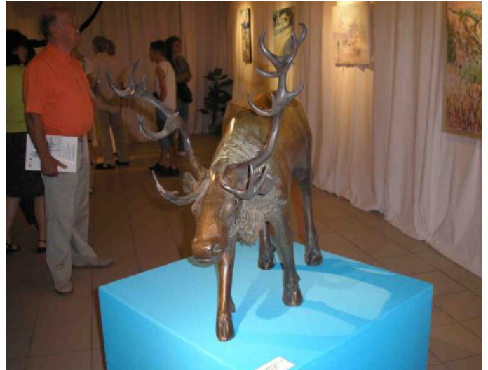
Un bel Elan