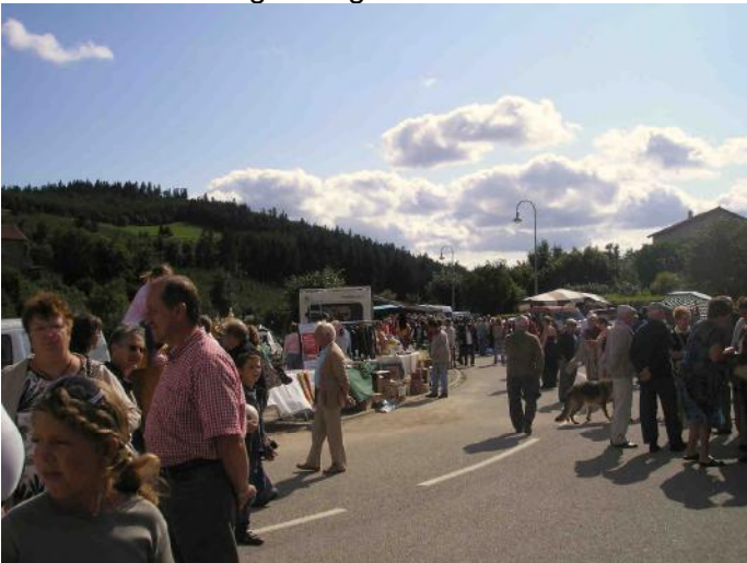
Forte participation des conseillers municipaux ...