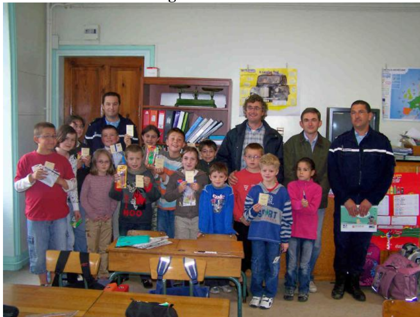
Ouf, Ils ont (presque tous) eu leur permis piéton !