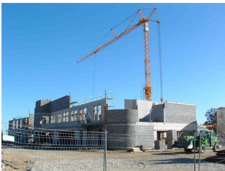
La construction de la nouvelle maison de retraite publique dont l'ouverture est prévue le 1 er avril 2009