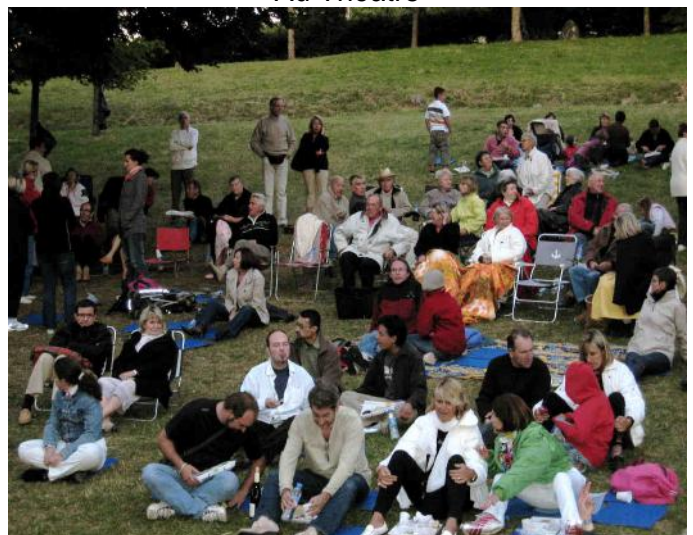
Ambiance Woodstock (40 ans après ...)