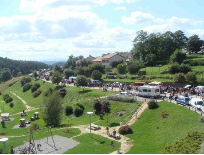
Un long cortège de visiteurs ...