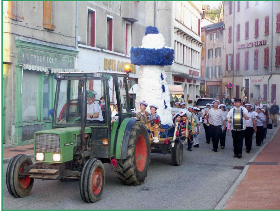
Fête de la Saint Jean