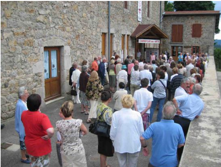
Le public se bouscule à l'entrée ...