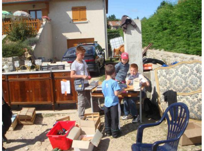
... de tous âges (7 à 77 ans ...)