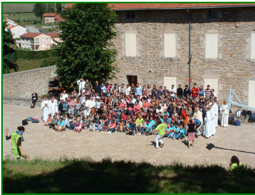
Rassemblement de jeunes dans le cadre des JMJ 2008