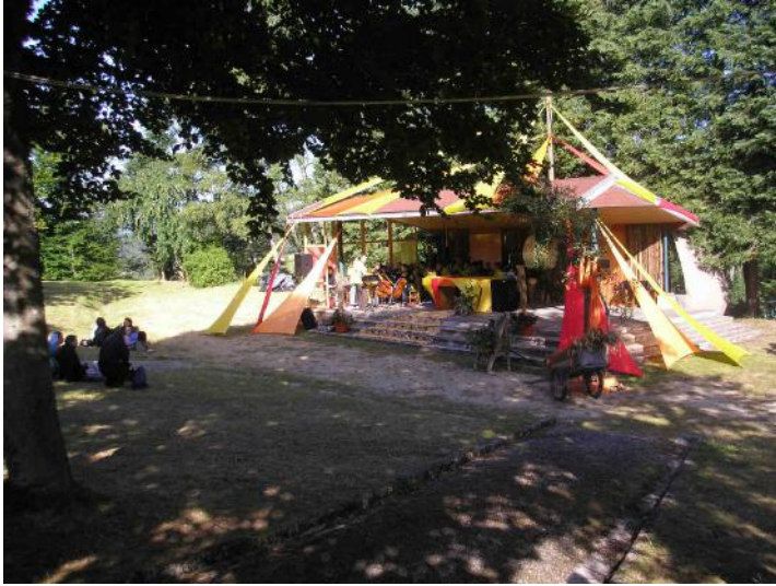
Les Journées Mondiales de la Jeunesse ...