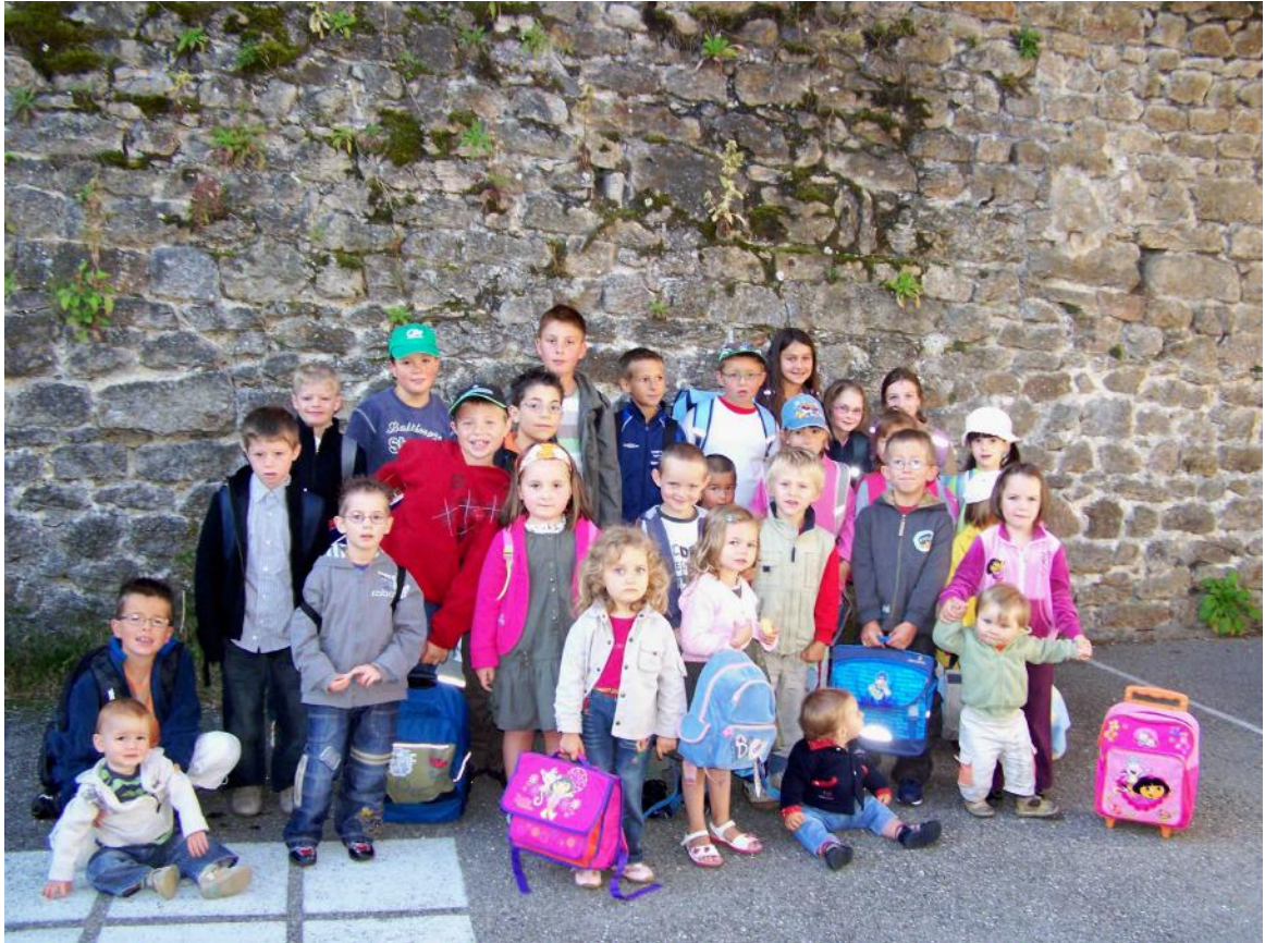
La relève semble assurée ...