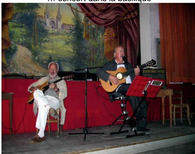
Retour au théâtre pour des chansons plus populaires

En 2009, les Promenades Musicales vont se structurer en association et nous recherchons des personnes disposées à soutenir et participer à ses activités : accueil et hébergement des musiciens, montage des concerts, participation aux opérations publicitaires etc.... Pour s'inscrire contacter le Docteur Chieze