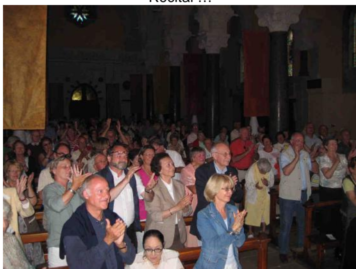
Ovation dans la basilique