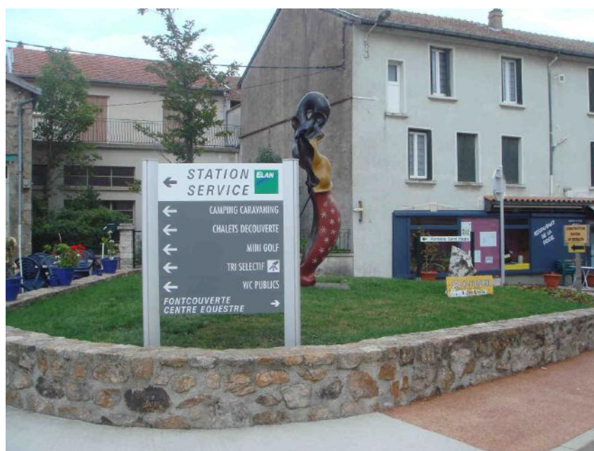
La Place du Lac est désormais en sens unique ...