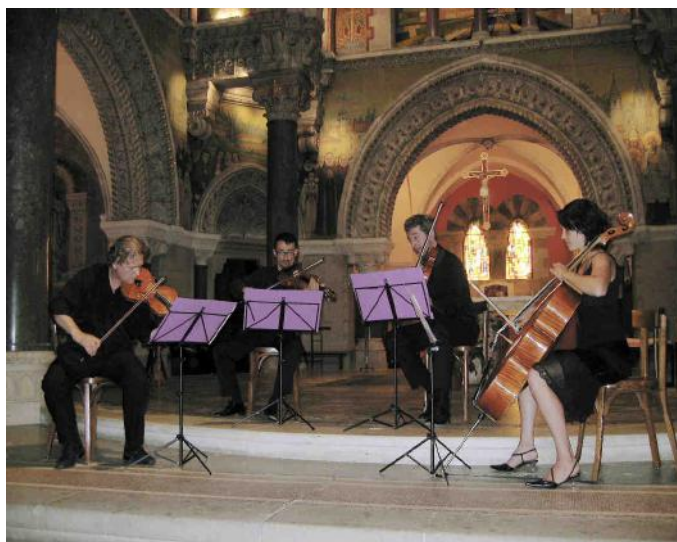
... concert dans la basilique