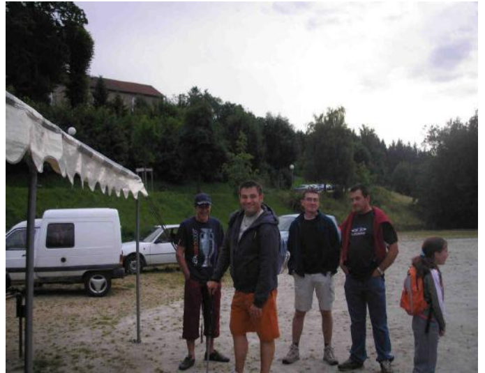
... inscriptions au Parc du Val d'Or